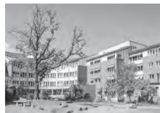
Kinderklinik „Tannenhof“ heute

dem „Kliniksankatorium Richard Abmann“ angeschlossen, welches seit 1991 als „AKG Reha-Zentrum“ fortgeführt wird.