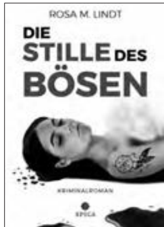
Cover des Kriminalromans von Marion Petznick

zu verraten, ohne Ihnen die Spannung auf das Buch zu nehmen.