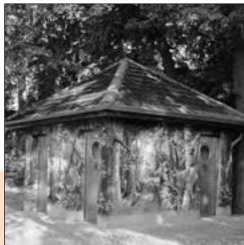
Die Sanitäreanlage vor dem Heimatmuseum.

Warum das Buch besonders für Graal-Müritz-Liebhaber interessant ist, wollte ich wissen.