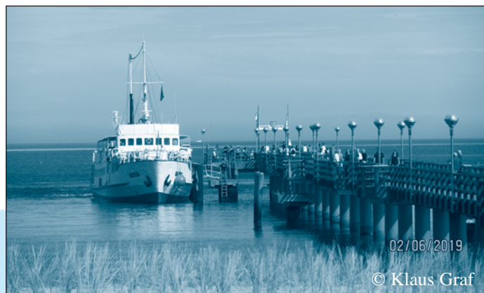
MS BALTICA am Sonntag um 10.00 Uhr. Leinen fest an der Seebücke Graal-Müritz.