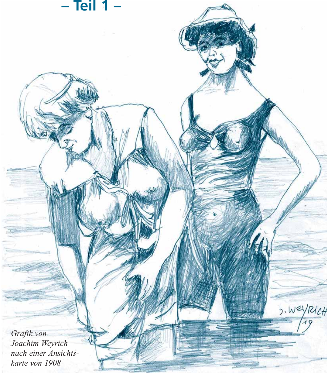
Grafik von Joachim Weyrich nach einer Ansichtskarte von 1908

Bereits 1794 wurde in Heiligendamm ein Badehaus mit 4 Wannensälen errichtet. Man genoss sozusagen die Ostsee im Zuber, leicht gewärmt. Außerdem fuhr man mit Schaluppen auf die Ostsee, diese besaßen achtern (hinten) einen durchlöchernten Holzkasten. Dort kletterten die Badegäste hinein, um sich von einem Badedienstler in die See tauchen zu lassen.